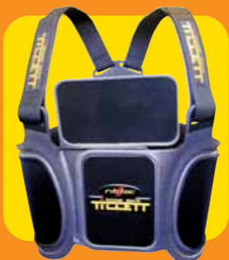
Protezioni vertebrali Ribtec per go kart... Tillet Racing