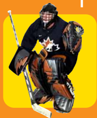
Plastazote offre protezione leggera e durevole nei parastinchi e nelle protezioni per il corpo dei portieri di hockey su ghiaccio... Battram Custom Goal Equipment

Queste straordinarie proprietà derivano dall'esclusiva tecnologia produttiva di Zotefoams, che realizza schiuma pura e chimicamente inerte senza residui di schiumogeni e con una struttura cellulare uniforme e a pareti standard.