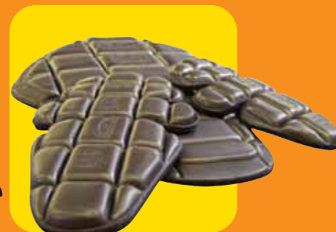
Protezioni superammortizzanti per il corpo dei piloti di motociclismo, approvati dalla CE... Planet Knox