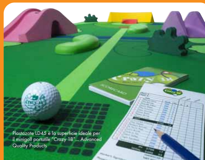
Plastazote LD45 è la superficie ideale per il minigolf portatile "Crazy 18"... Advanced Quality Products