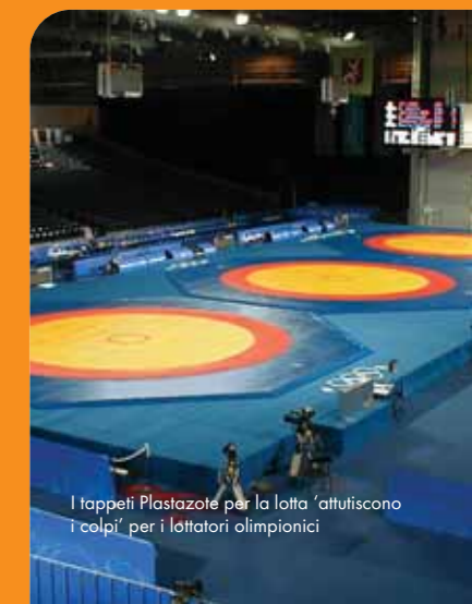
I tappeti Plastazote per la lotta 'attuscono i colpi' per i lottatori olimpionici