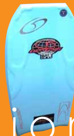
Tavola per corpo ad alta specifica, con il vantaggio dell'alto rapporto rigidità:peso offerto da Plastazote

Le schiume Azote sono probabilmente i prodotti a cellule chiuse i più diffusi nei settori di sport e di tempo libero. Grazie alle proprietà superiori e alle superlative prestazioni, le schiume Azote sono la scelta naturale per tutta una serie di applicazioni diversificate - dagli accessori per il nuoto alla strumentazione per ortopedia correttiva; dagli zaini alle protezioni per il corpo; dalle imbottiture per il cricket ai tappetini per il campeggio, e dai rivestimenti per i caschi alle imbottiture per manubri.