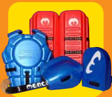
I portieri internazionali di hockey su ghiaccio si proteggono grazie alle proprietà assorbenti di Plastazote