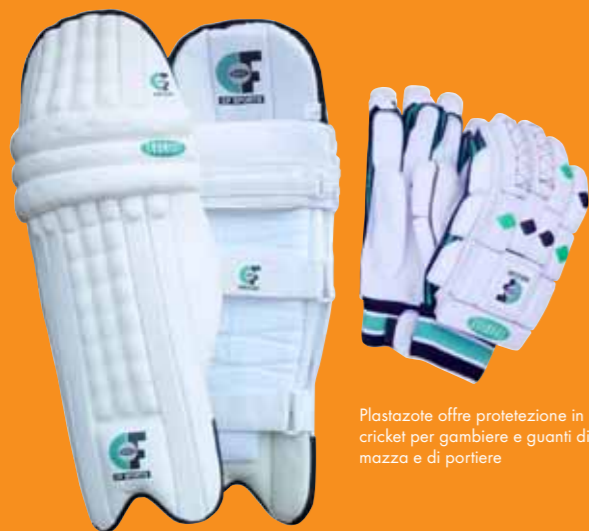
Plastazote offre protezione in cricket per gamba e guanti di mazza e di portiere